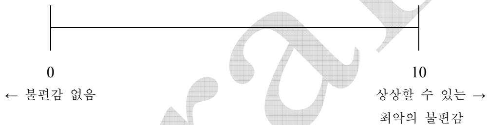
표 2. VAS scoring system 판단 예시