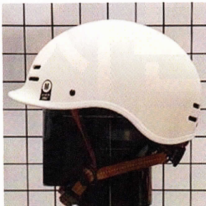
< 측 면 >