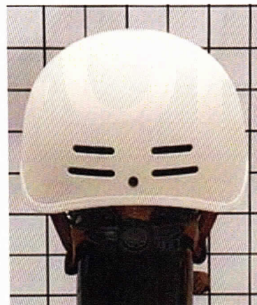
< 후 면 >