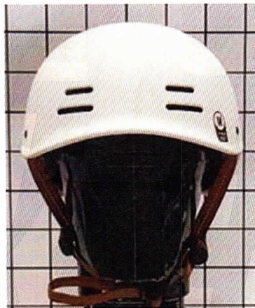
< 전 면 >