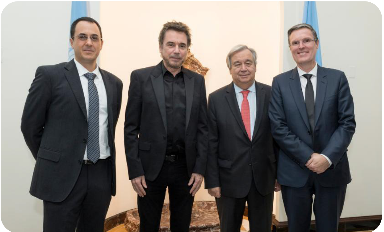
▲ 2019년 CISAC 뉴욕 방문 - 안토니오 구테흐스 UN 사무총장 참석