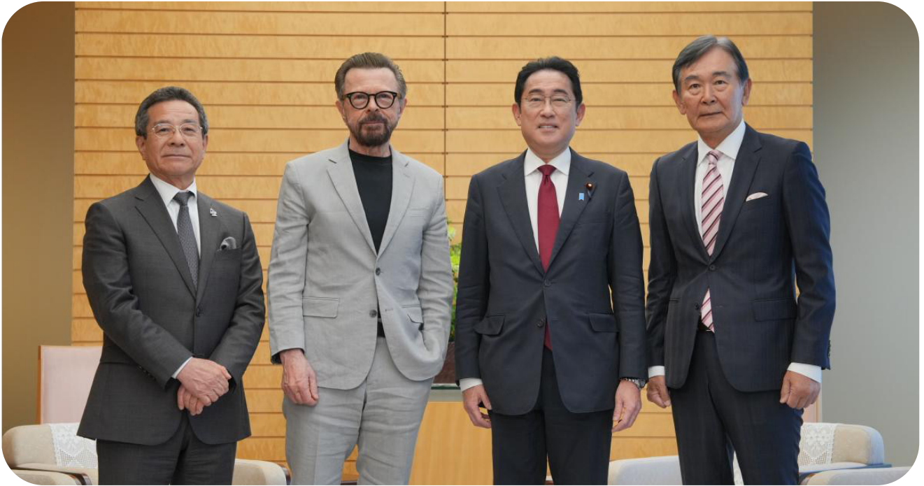
▲ 2023년 CISAC 일본 방문 - 기시다 후미오 일본 총리 참석