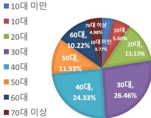
&lt;외지인, 외국인 연계관광지 분석&gt;