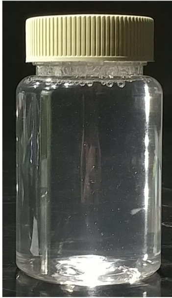
< 더모티브 리프레싱 풋 샴푸 >