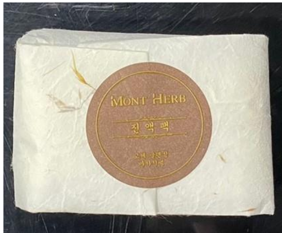
< 몽뜨허브 진액팩 >