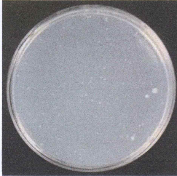
< Control >