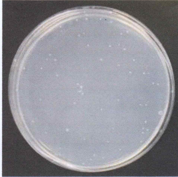
< Control >