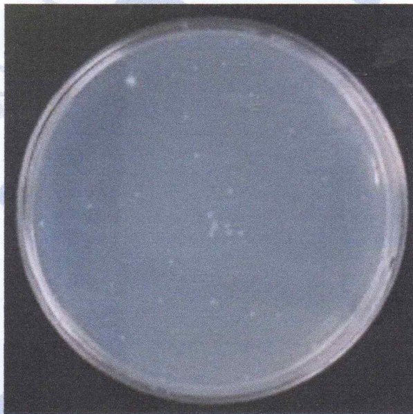
< 시료 >