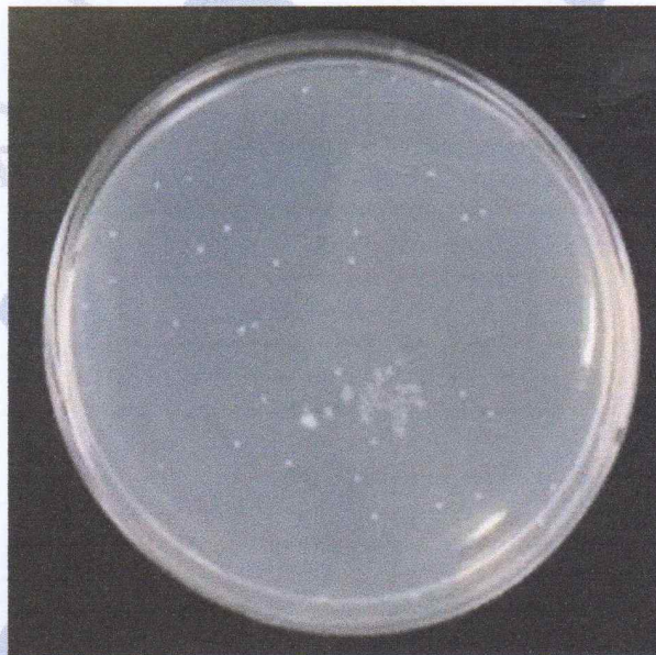
< 시료 >