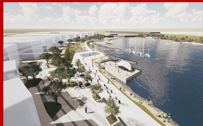
수변광장 워터프론트 상권