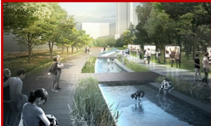
호수공원 순환하는 수변길